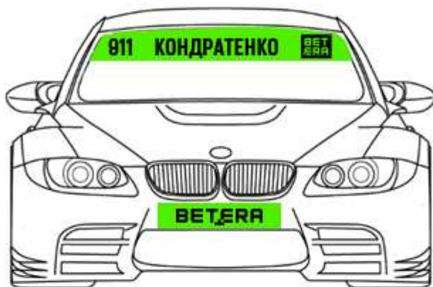
Схема размещения наклеек