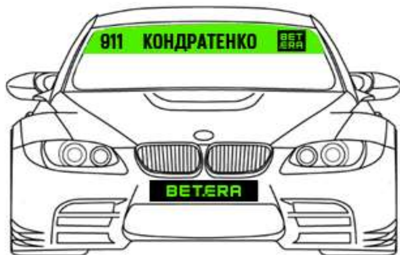
Схема размещения наклеек