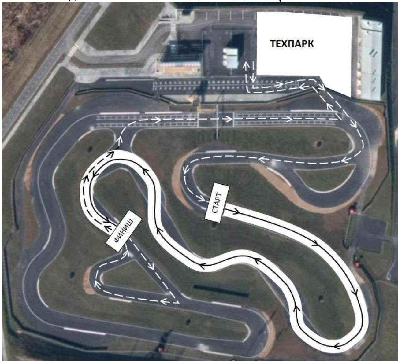
СХЕМА ДВИЖЕНИЯ ПО ТРАССЕ И ВОЗВРАЩЕНИЯ В ТЕХПАРК