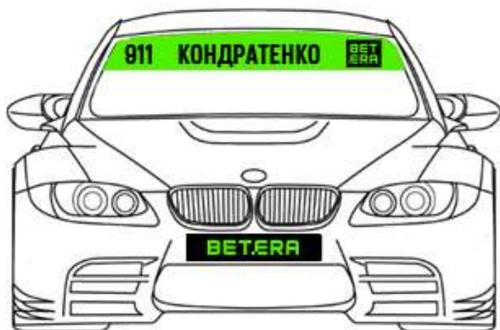
Схема размещения наклеек