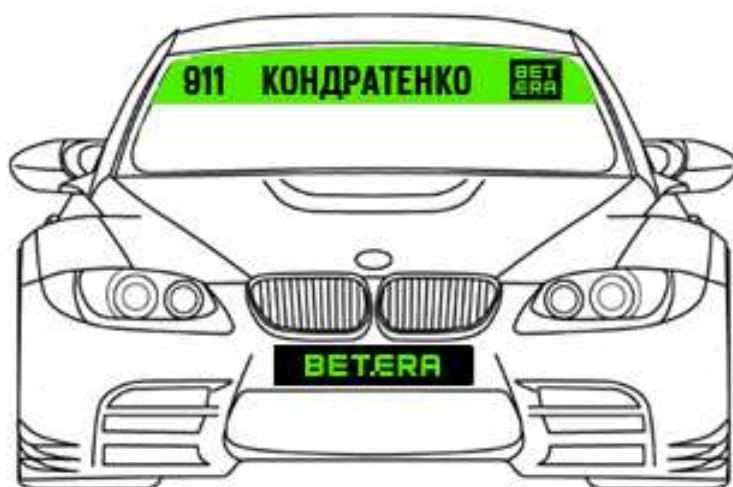
Схема размещения наклеек