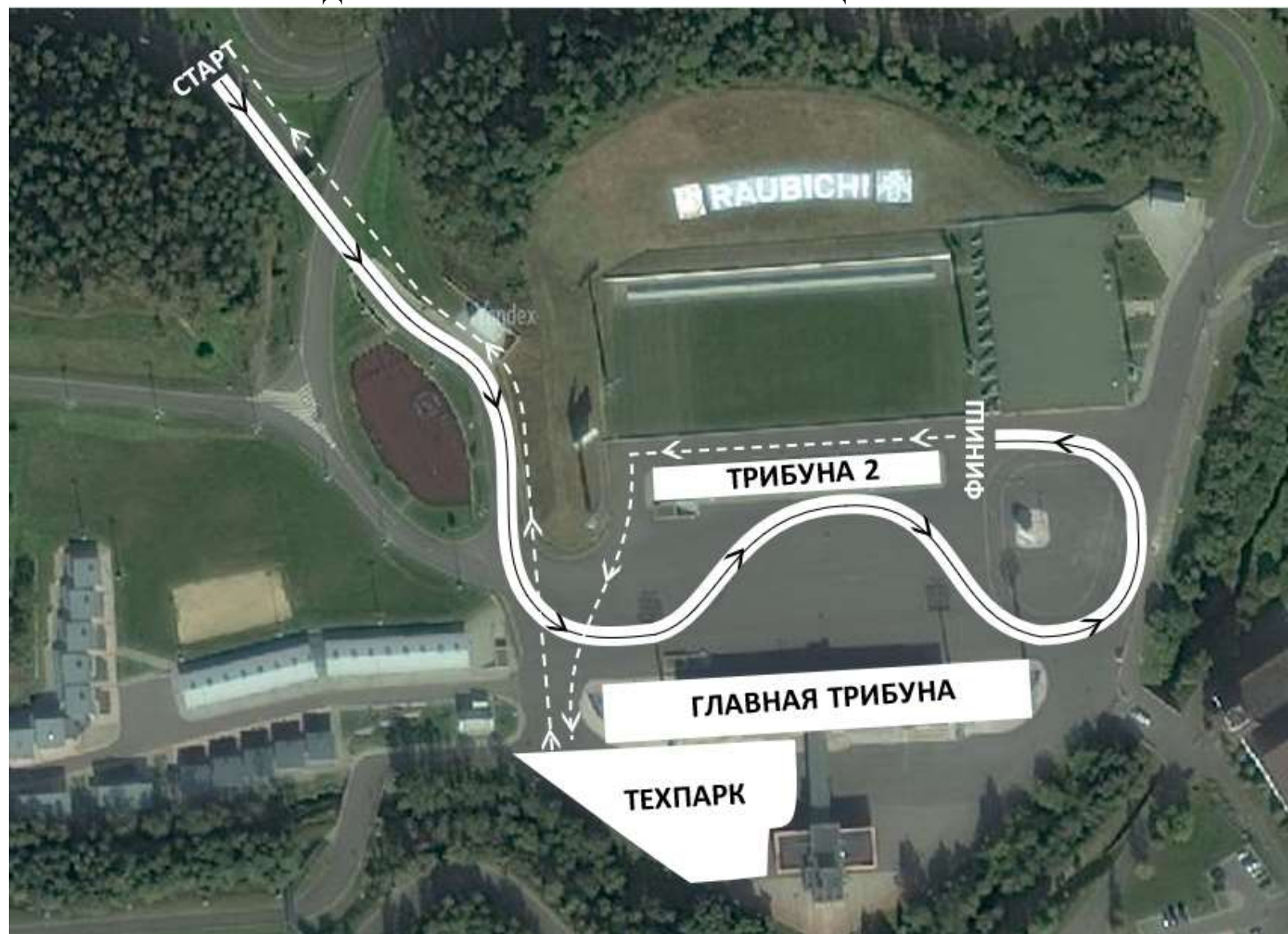
СХЕМА ДВИЖЕНИЯ ПО ТРАССЕ И ВОЗВРАЩЕНИЯ В ТЕХПАРК