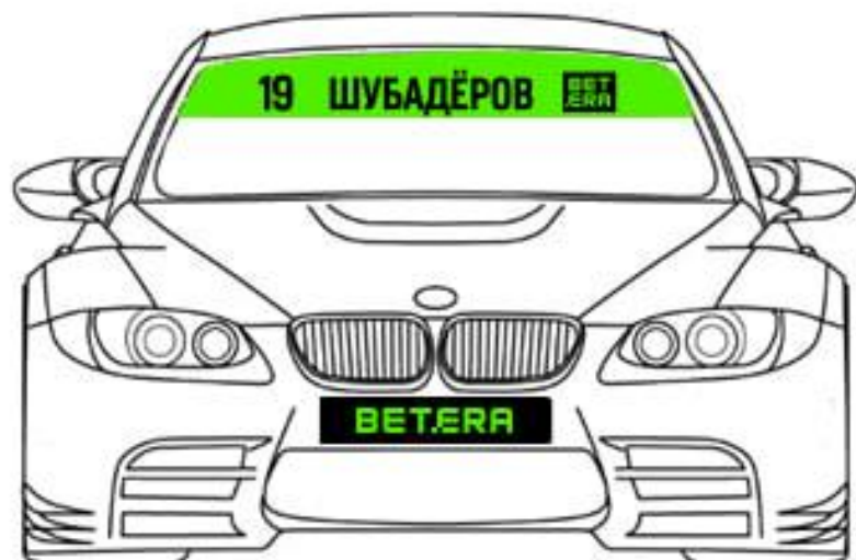
Схема размещения наклеек