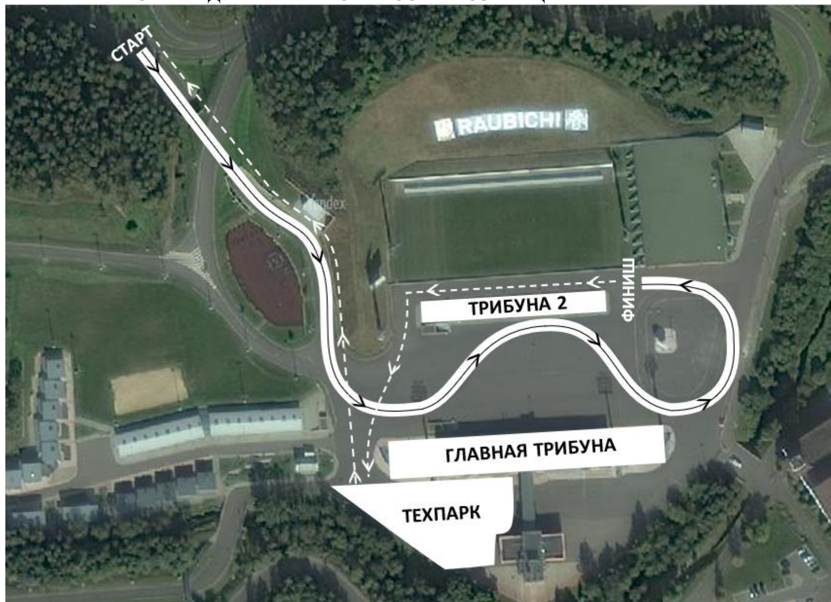
СХЕМА ДВИЖЕНИЯ ПО ТРАССЕ И ВОЗВРАЩЕНИЯ В ТЕХПАРК